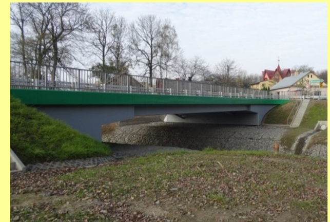
Most przez rzekę Mleczka w m. Bystrowice