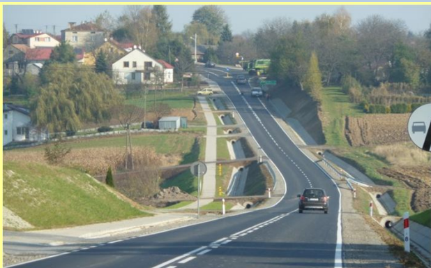
Droga w km 3+800