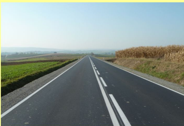
Droga w km 11+900