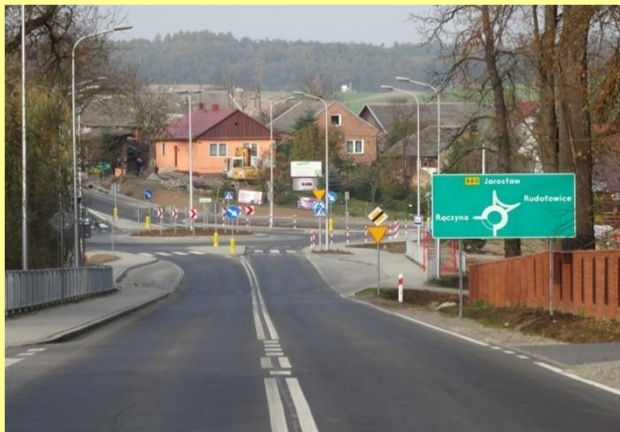
Rondo w m. Roźwienica w km 10+096