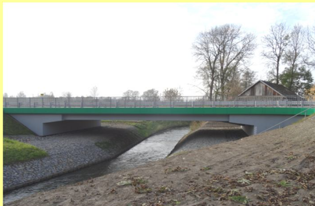
Most przez rzekę Mlecza w m. Bystrowice