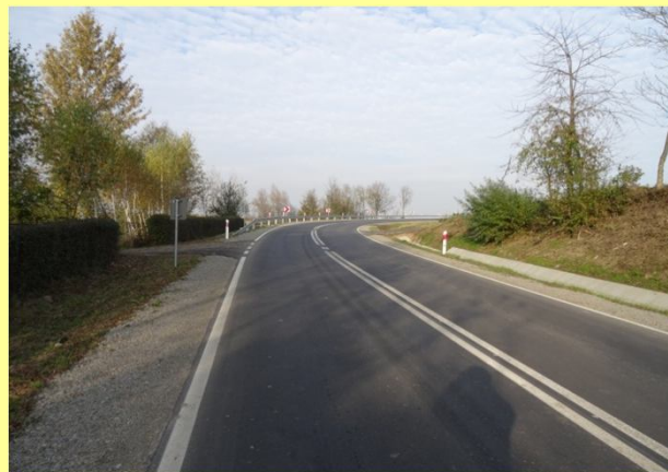
Droga w km 12+765